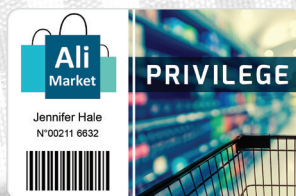
Cartes de fidélité