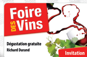
Invitations à vos événements